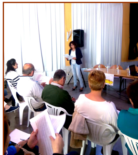
Ortiguera a 12 de junio de 2015